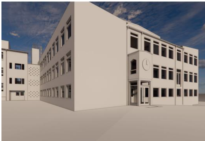
Bild 2: Ny tillgänglig huvudentré med hiss vid befintlig matsal i hus B

På Blackebergsskolan finns idag 27 toaletter inklusive RWC. Antalet inkluderar toaletter i matsal, hus D och i källaren. Förvaltningen föreslår att det skapas ytterligare 15 toaletter fördelade över skolan vilket innebär att skolan kommer ha 42 toaletter efter avslutat projekt. Med denna åtgärd uppfyller lokalerna myndighetskrav avseende antal toaletter per person.